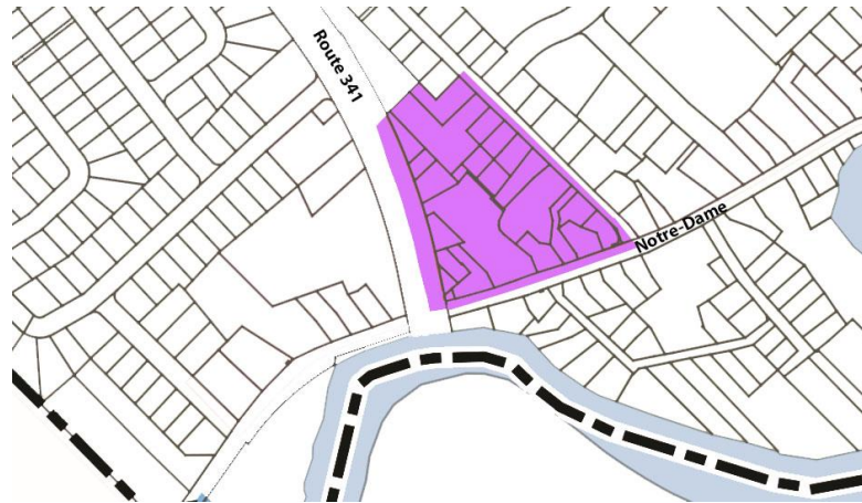
Planche 1.2 : Le secteur de l'intersection de la 339 et de la 341

Ce secteur devra être assujéti à un règlement sur les Plans d'implantation et d'intégration architectural (PIIA), dont l'objectif devra être de s'assurer que les projets de développement ou de redéveloppement permettront une intégration harmonieuse des constructions et aménagements projetés au milieu environnant (constructions, infrastructures, aménagements, etc.). Des critères spécifiques devront y être prévus afin d'assurer une cohérence et une intégration harmonieuse des bâtiments par leur gabarit, leur volumétrie, les matériaux de revêtement extérieur utilisés, la qualité de l'architecture, l'harmonisation des bâtiments accessoires aux bâtiments principaux, ainsi que la mise en valeur des bâtiments patrimoniaux du secteur. Des critères devront également être prévus afin d'assurer un traitement paysager homogène de qualité, de limiter l'impact visuel des espaces de stationnement, de prévoir des zones tampons végétalisées entre les usages résidentiels et non résidentiels, ainsi que de créer une entrée de ville attrayante et distinctive.